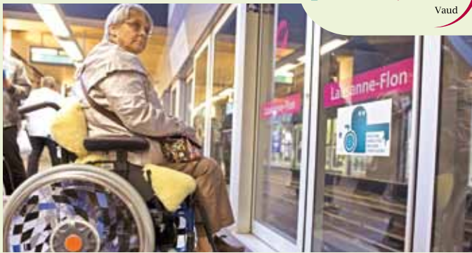
Opération de street marketing dans le métro M2

Avec le slogan « C'est facile de vivre ensemble ! » Pro Infirmis Vaud s'est lancé dans une opération de street marketing. Plus de 5000 autocollants et affichettes désignaient au quidam les facilités et les obstacles pour les personnes handicapées dans l'environnement urbain et dans divers bâtiments, tels ceux du CHUV.