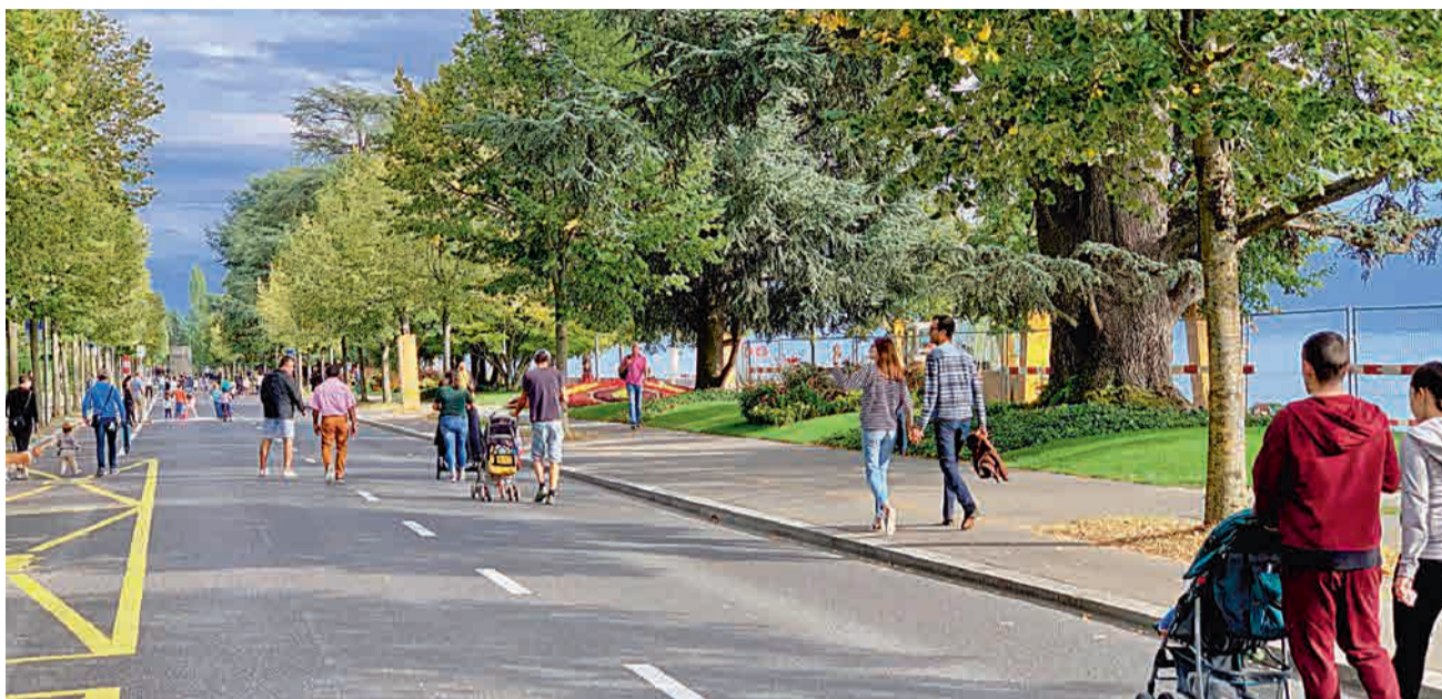
Le quai de Belgique sera encore fermé au trafic pendant deux week-ends.

Durant la Semaine de la mobilité, du 16 au 22 septembre, les amateurs et amateurs de balades urbaines pourront découvrir les nouveaux