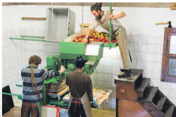
Le pressoir public vous accueille jusqu'au 31 octobre.

Les prix sont de CHF 1.80 à CHF 2.60 par litre tout compris selon le type de conditionnement et la provenance des clients, les lausannoises et les lausan-