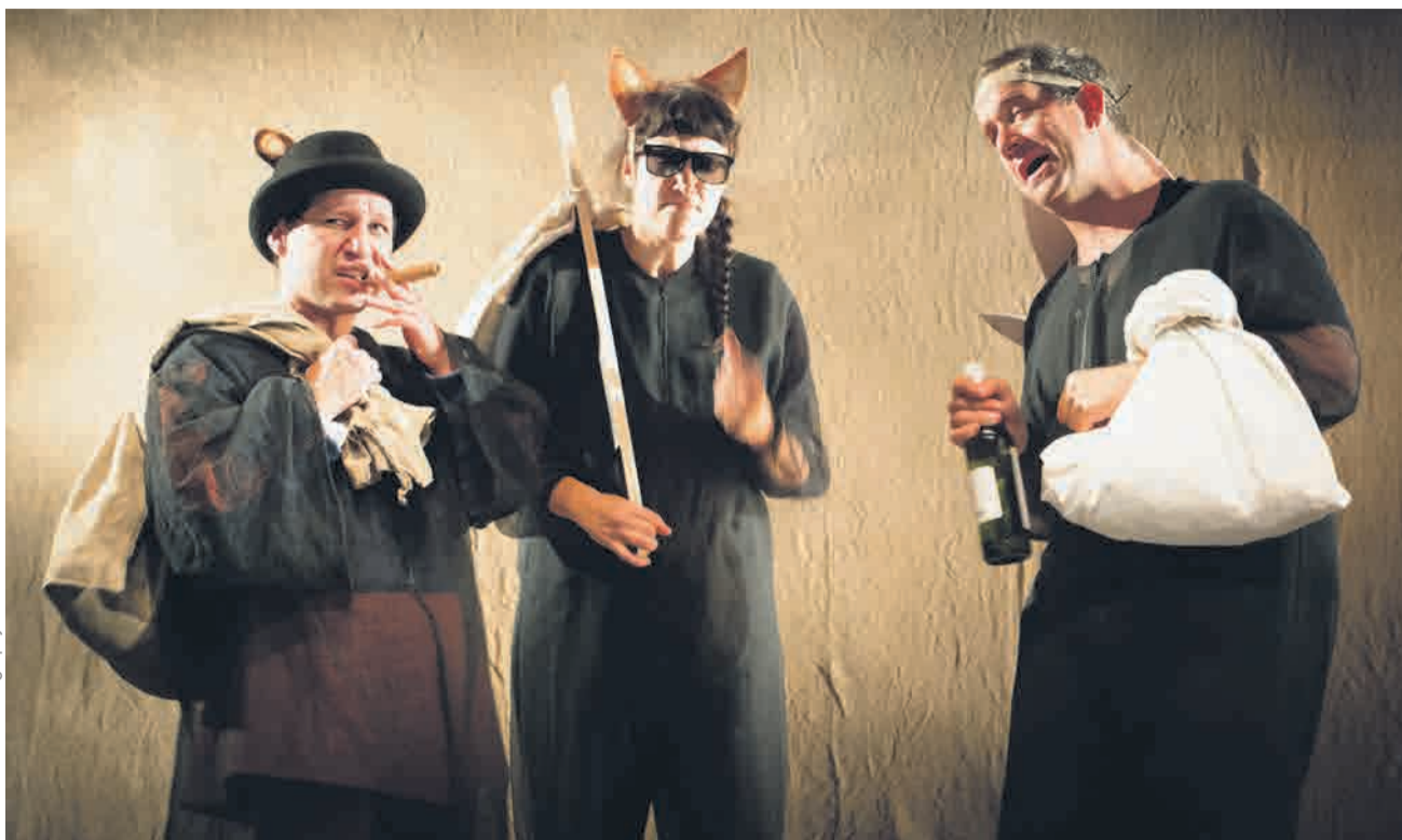
Le spectacle Les deux frères affiche complet.